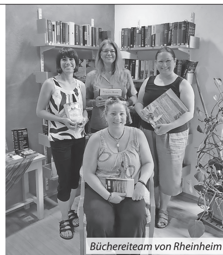
Büchereiteam von Rheinheim

Ehemalige Zehntscheuer, Zurzacher Straße 6